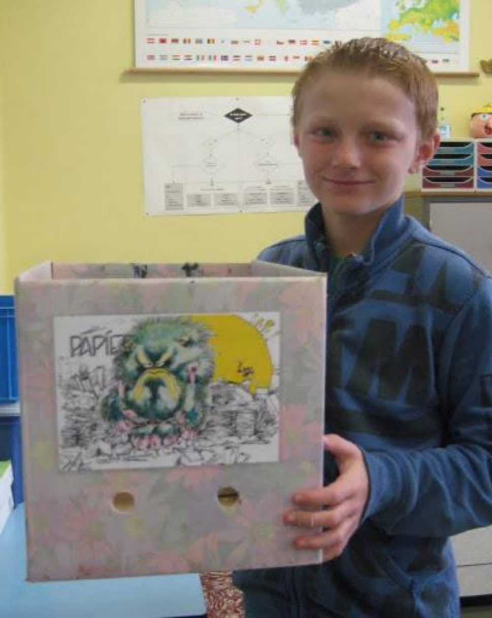
Responsible for litter