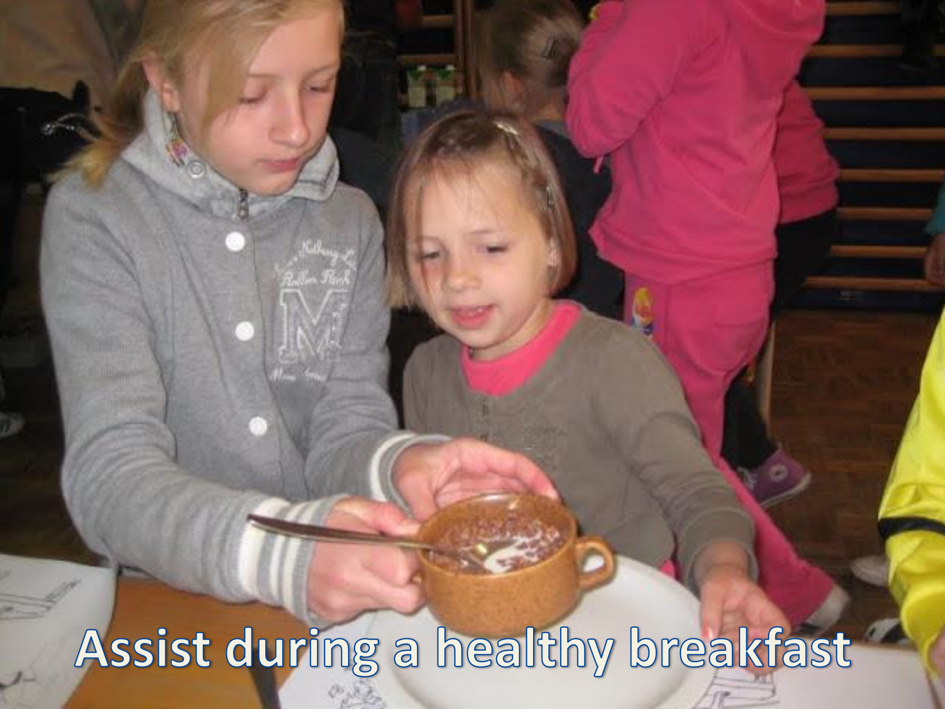
Assist during a healthy breakfast