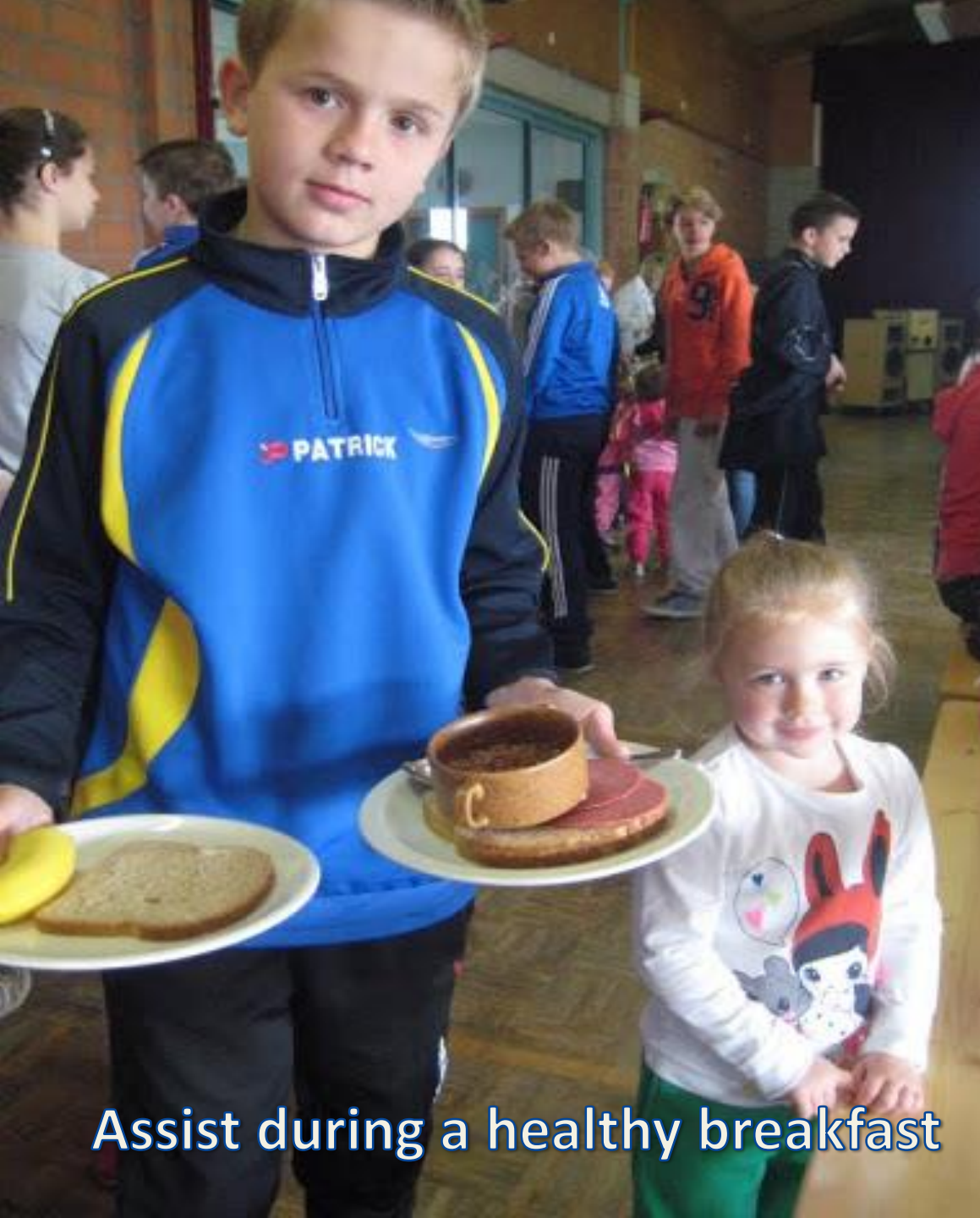
Assist during a healthy breakfast