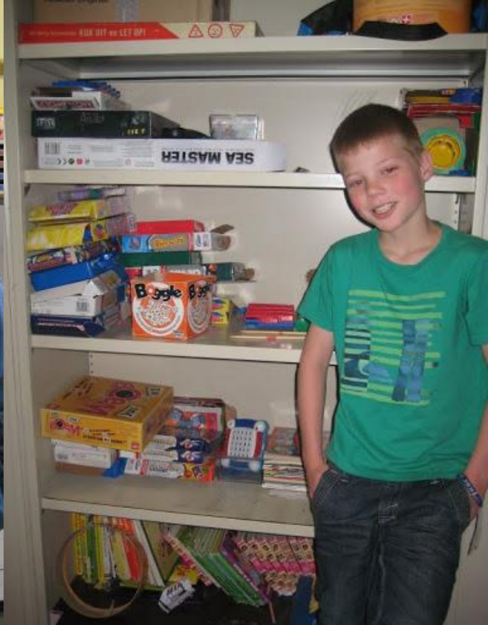
Responsible for games and toys